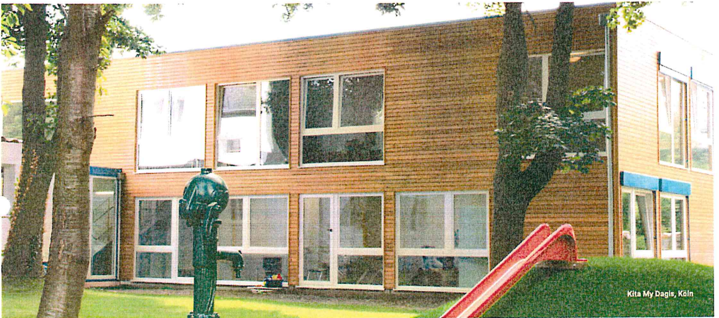
Kita My Dagis, Köln

Was kostet meine Kita? Hier Kosten berechnen lassen >