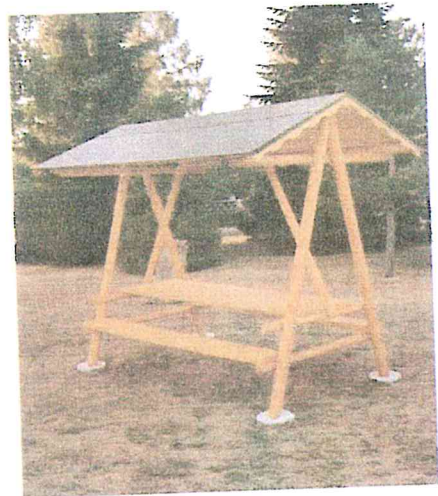
Zum Heranzoomen mit der Maus über das Bild fahren