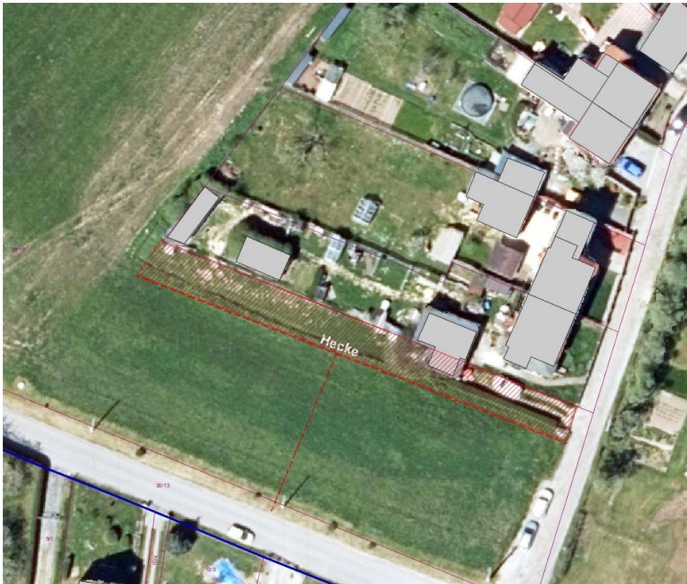
Abb. 6 Überbauung Flurstück 70/16